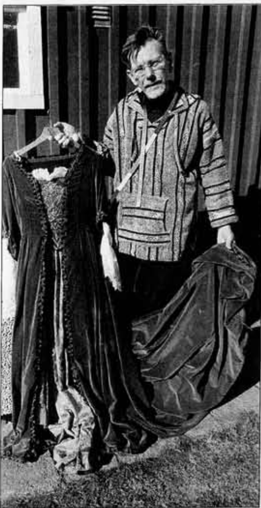
En vacker barockklänning från perioden 1690-1700.