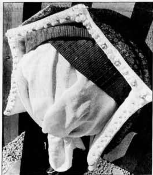
Gablehooden användes på mitten av 1500-talet. Ordet betyder "gavelhatta" och denna hätta är sydd efter inspiration från ett porträtt av Jane Seymour som var engelsk drottning och kung Henrik VIII:s tredje hustru.